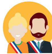
COLLÈGE DES ÉLUS