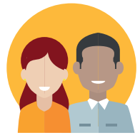
COLLÈGE DES ACTEURS ÉCONOMIQUES & SOCIAUX