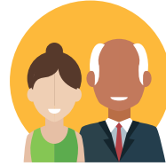
COLLÈGE DES PERSONNALITÉS QUALIFIÉES