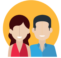
COLLÈGE DES HABITANTS