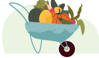
Un quartier où l'alimentation est durable et de qualité et accessible à tous et toutes