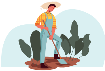
Un quartier cultivé et végétalisé par et pour les habitants