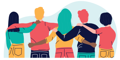
Un quartier de mixité sociale et de vivre-ensemble

L'objectif est d'inscrire le quartier Basseau-Grande Garenne dans une expérimentation autour des enjeux de la transition alimentaire. Le quartier serait le premier lieu de sensibilisation, d'animation et d'innovation sur les questions de l'alimentation, de la production agricole et de la santé. L'expérience de ce quartier pilote pourrait être transmise à d'autres quartiers de GrandAngoulême.