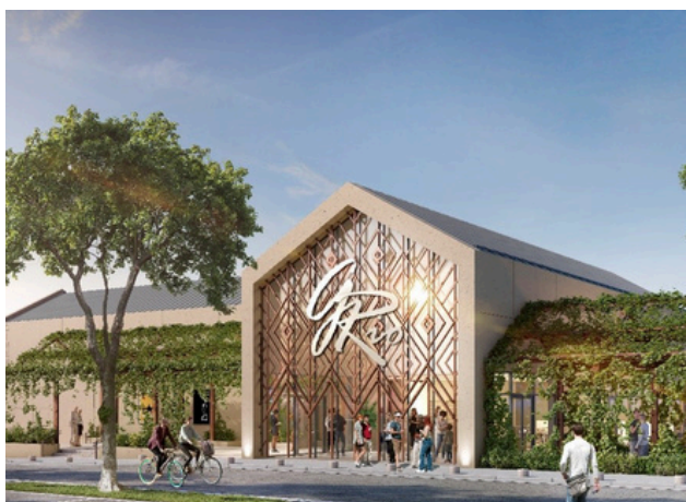
© ID Ciné / MR3A Architectes