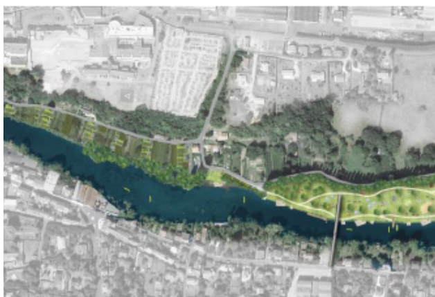
© Les Ilettes – Plan Guide « Montmorillon 2030 » - Citadia Conseil